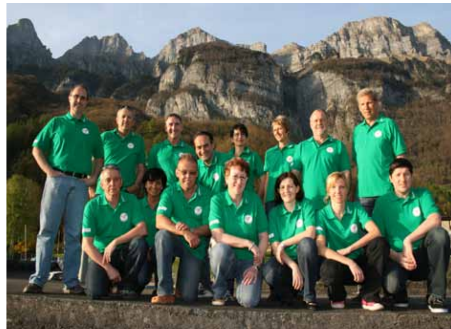
Das fast komplette OK des 6. Kantonalen Sport-Fit-Tages vom 28. Mai in Walenstadt.