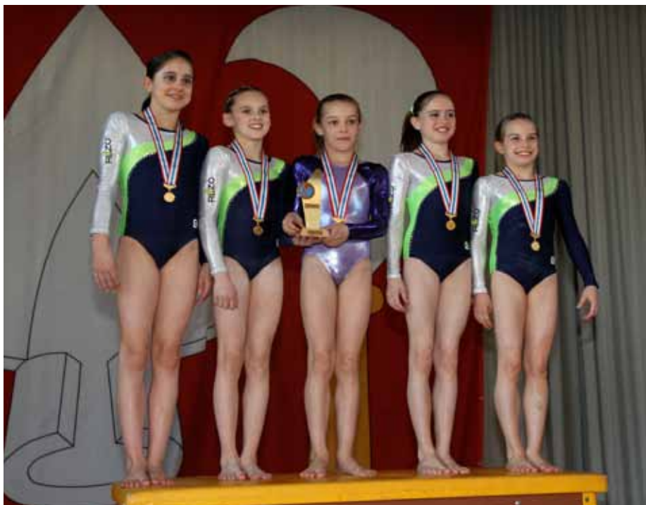
Siegerteam Programm 4 v l n r: