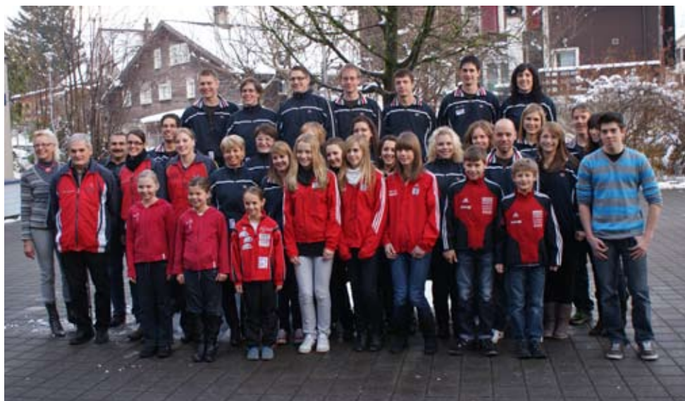
Bild: Erfolgreiche Sportlerinnen und Sportler 2010