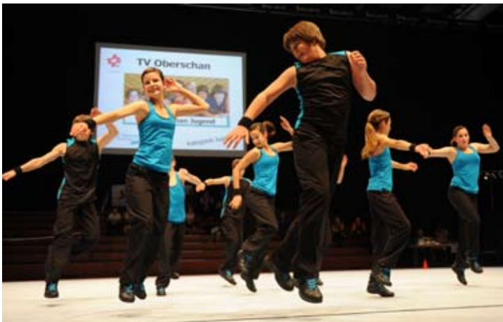
TV Oberschan 3. Rang in der Kat. Jugend.

Nach einem Einbruch im letzten Jahr kämpfte der STV Gränichen heuer wieder an der Spitze der Aktivkategorie mit. Die Qualifikationsrunde beendeten die sieben Aargauerinnen mit der zweithöchsten Punktzahl hinter dem TV Lenzburg. Im Final hielten die Nerven nicht ganz Stand, womit sie auf den vierten Platz zurückfielen.