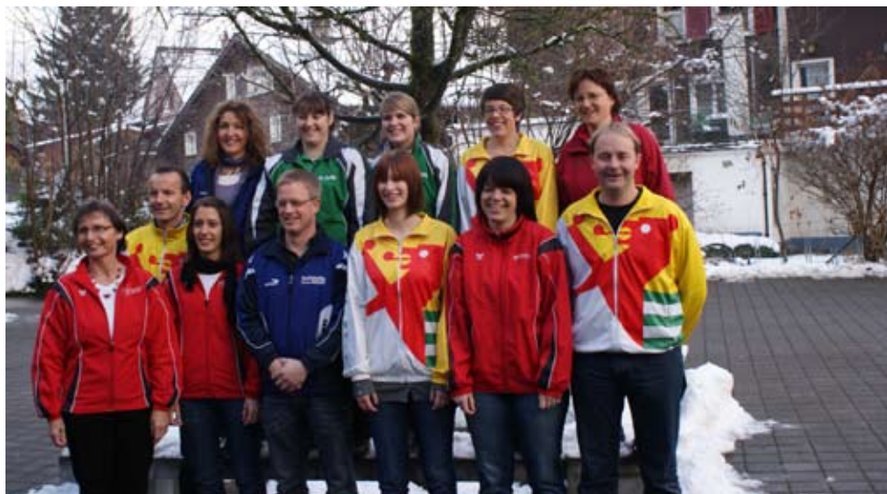
Bild: Geehrte langjährige Leiterinnen und Leiter